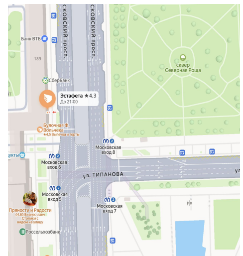
ст. м. Московская

Желаем вам приятного путешествия и хорошего настроения!