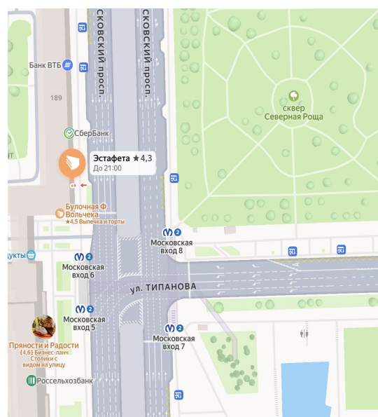
ст. м. Московская

Желаем вам приятного путешествия и хорошего настроения!