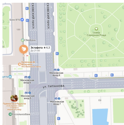
ст. м. Московская

Желаем вам приятного путешествия и хорошего настроения!